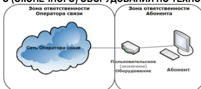
СХЕМА ВКЛЮЧЕНИЯ ПОЛЬЗОВАТЕЛЬСКОГО (ОКОНЕЧНОГО) ОБОРУДОВАНИЯ ПО ТЕХНОЛОГИИ xPON